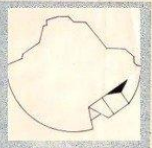
Finale Ligure - Idrovolante Wal, allestito dai Cantieri Piaggio e C. davanti l'idroscalo di ritorno dal collaudo